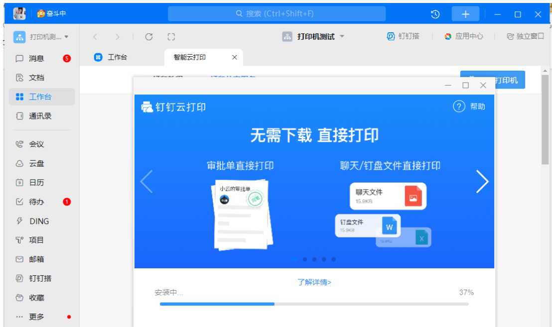
6 打印共享服务会自动搜索打印机